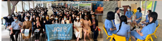
德貞 / 真光女書院服務日 - 生涯規劃分享