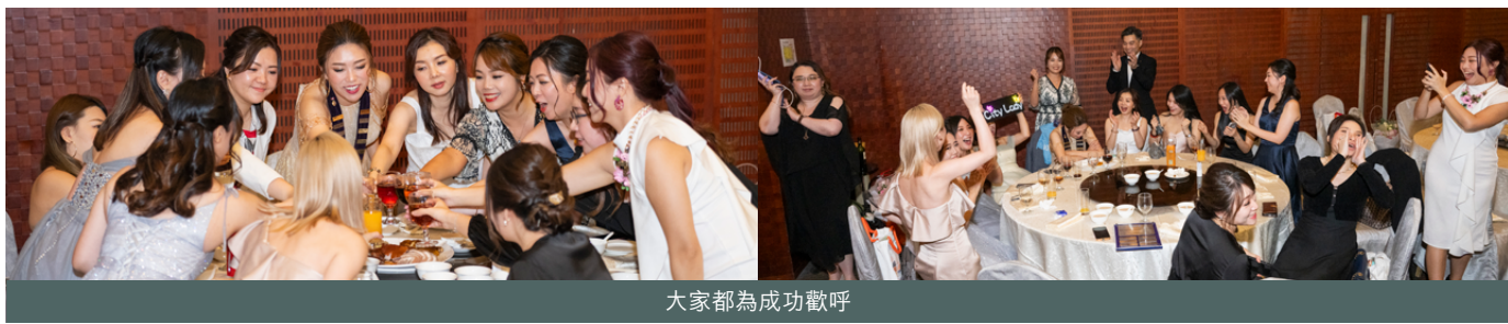
大家都為成功歡呼

在香港的 21 個分會的見證下，周年大會也成功選出以 2024 年香港總會會長麥頌斌參議員為首的 2024 年香港總會董事局成員。香港總會本年的口號是「Connect To Evolve」，期待本年度隨著總會的帶領，引導城市女青年商會再創高峰，為社會帶來更多正面的改變！