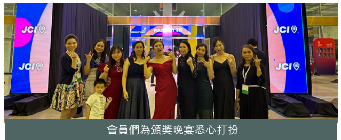
會員們為頒獎晚宴悉心打扮