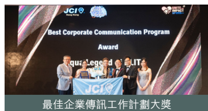
最佳企業傳訊工作計劃大獎