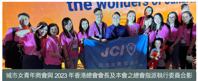
城市女青年商會與 2023 年香港總會會長及本會之總會指派執行委員合影