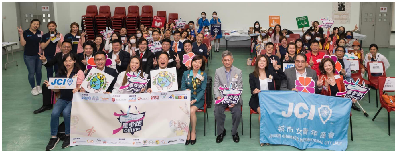
3 月 8 號開幕禮暨親子繪畫工作坊，邀請了主禮嘉賓文化體育及旅遊局副局長劉震先生和活動大使黃乙頤女士

我們歷時半年的社會發展旗艦活動，小手愛地球 2023《童步跑 Offline》舉行了五場大大小小的繪畫「白飯魚」工作坊，閉幕禮更以親子運動嘉年華的形式進行了一系列活動，當中的親子二人三足活動，帶出親子間合拍性的重要，並利用這些活動分享我們的理念小朋友的人生是可以由自己編織，一步一步走出屬於自己色彩斑斕的人生。疫後的生活，我們更需要密切關注兒童在復課後的適應，因為不少兒童可能會因突然不同的節奏而令心理壓力大增，導致情緒、精神健康欠佳。