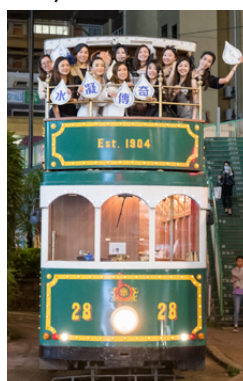
2023 全港時尚專業女性選舉電車交流派對