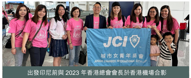
出發印尼前與 2023 年香港總會會長於香港機場合影