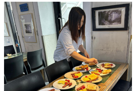
會長親自下廚，帶領董事局成員為所有參加者準備豐富早餐

訓練自己，服務社會！我們除了參加了 2023 年 11 月 4 日，一整日由城市青年商會及城市女青年商會合辦的董事局聯會訓練日外，我們亦參加了年 12 月 2 至 3 日兩天的訓練營，希望大家可以活學活用，大家一起煮食，一起觀賞漂亮的維港景色。在此多謝多位前會長們的寶貴意見及分享。