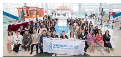
2023 全港時尚專業女性選舉開幕禮