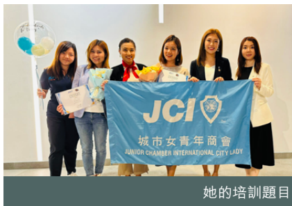
她的培訓題目是「情來自有方」