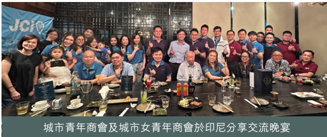
城市青年商會及城市女青年商會於印尼分享交流晚宴