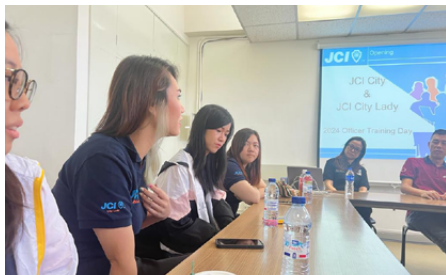
各位董事局成員積極參與培訓