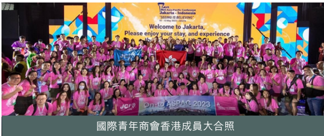
國際青年商會香港成員大合照