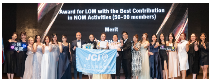
最傑出分會貢獻總會活動 (56-90 人分會) 優異獎