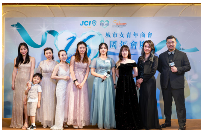
感謝會慶籌委會每一位成員的付出，讓每位出席的來賓都賓至如歸