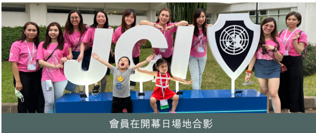
會員在開幕日場地合影

本會有 15 位會友及其家人一起於印尼雅加達渡過了開心難忘的旅程。期待 2024 與大家柬埔寨見！