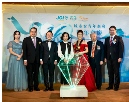
主禮嘉賓民政及青年事務局局長麥美娟，SBS, JP 一同進行亮燈儀式