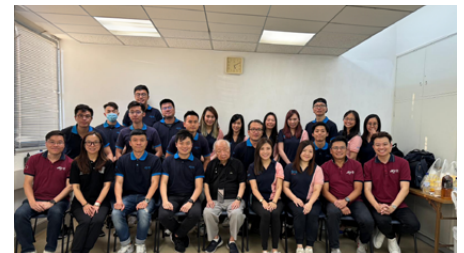
城市青年商會及城市女青年商會合辦的董事局聯會訓練日