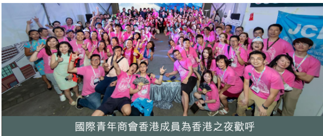
國際青年商會香港成員為香港之夜歡呼