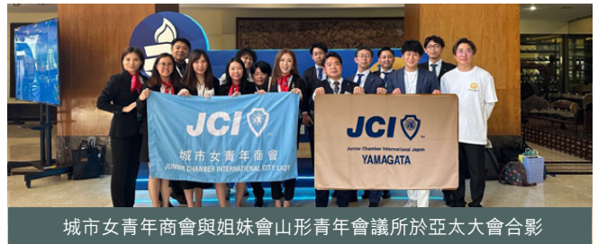
城市女青年商會與姐妹會山形青年會議所於亞太大會合影