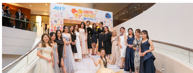
一眾城市女青年商會會員