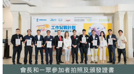
會長和一眾參加者拍照及頒發證書