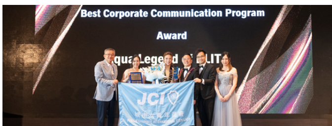
最佳企業傳訊工作計劃大獎：Aqua Legend of ELITE