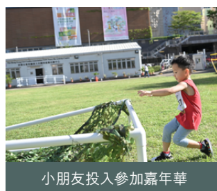
小朋友投入參加嘉年華